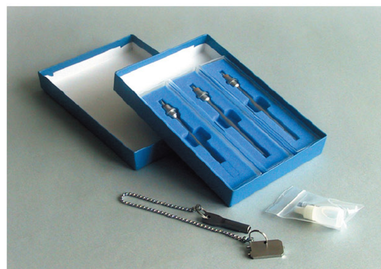
シャフト3本セット例(NS-3・NS-4・NS-7) お得な3本セットもご用意しました。 3種類のシャフトから組み合わせは自由にお選びいただけます。