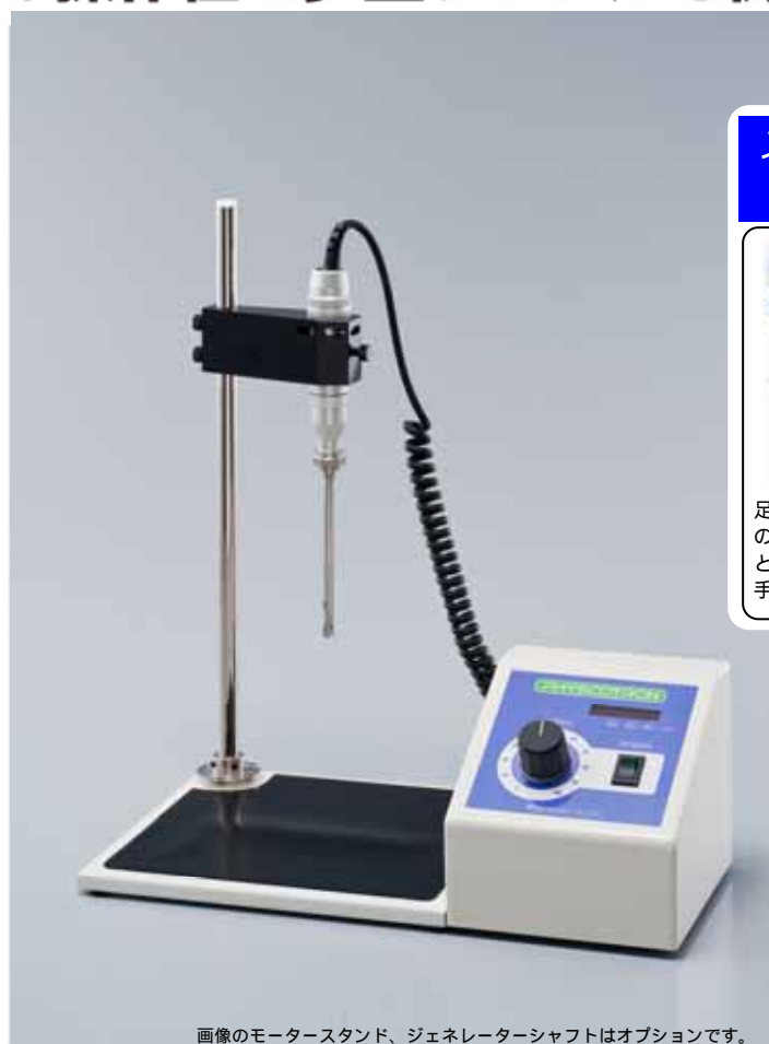
画像のモータースタンド、ジェネレーターシャフトはオプションです。